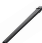
ロング隙間ノズル