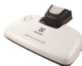
ベッド・プロ・パワー™ UV ノズル