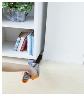
ロング隙間ノズル