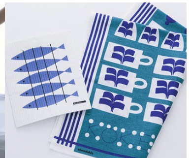
スウェーデン almedahls キッチンタオル & スポンジワイプセット