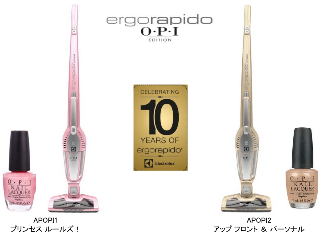
APOP11 プリンセス ルールズ!

エレクトロラックスは、今後も皆さまがより快適にお掃除できる製品を提供してまいります。