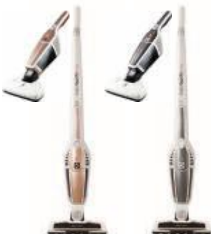
ZB3233B ラグジュアリーローズ