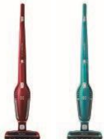
ZB3101 ウォーターメロンレッド