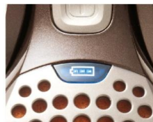
見やすい 充電残量ディスプレイ