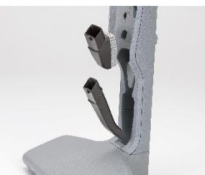
付属品が収納できる 充電スタンド