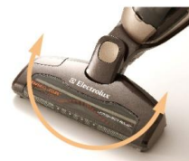
180度自在に動く ブラシヘッド