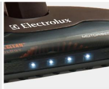
暗いところを照らす LED4点ライト