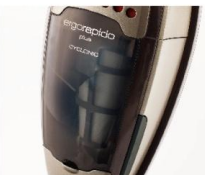
お手入れ・ゴミ捨ても簡単