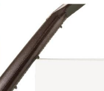
滑らず立てかけられる ストリップ