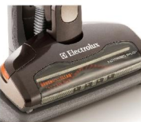
充電完了後に 消費電力を自動抑制