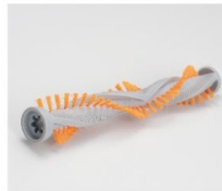
パワフルにかきとる 高速回転ブラシ

コードを気にしたり、コンセントの差し替えが必要なく、片手で手軽に扱えるためストレスなくお掃除できます。