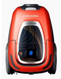
auto (ソーラーオレンジ)