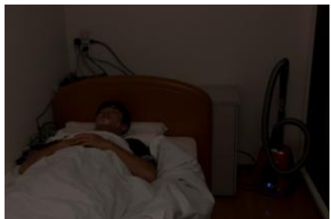
(睡眠中にエルゴスリーを運転)

実験の協力者は、成人男性3名。実験に使用したのは「エルゴスリー」と他社のプレミアム掃除機2台で、1台は静音性を特徴としている機種。被験者の枕元で掃除機を運転した場合には、確実に被験者の目が覚めてしまうだろうとの予測のもと、隣の部屋に別の二人の被験者に寝てもらい、掃除機を運転させている部屋の扉を開けた状態と、閉めた状態で隣室の被験者の睡眠にどれだけ影響するのかを実験する予定でした。しかし、驚くべきことに、被験者の枕元でエルゴスリーを通常モード1で運転した場合でも、運転音が睡眠を妨害することなく、被験者はぐっすりと眠ったままだったのです。もちろん隣室の被験者もとても深い眠りだということを表す睡眠の深さ4を記録しました。