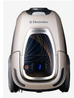
multifloor (ダイヤモンドサンド)