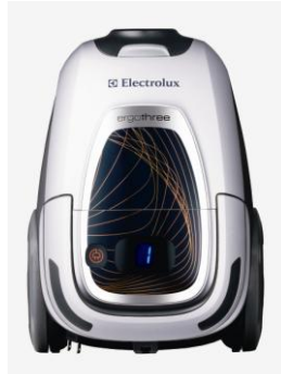
power (アストラルホワイト)