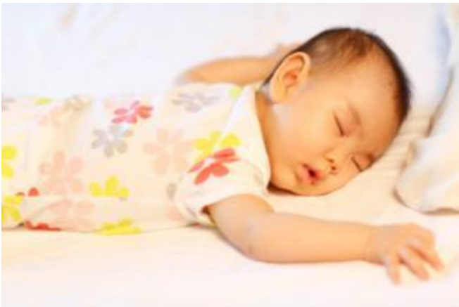
(赤ちゃんへの睡眠の影響も計測)

また、日常に近い状態で、赤ちゃんが寝ている横でお母さんがエルゴスリーを運転する実験でも、計測した行動計の結果、赤ちゃんは目覚めることなく気持ちよさそうに寝たままでした。