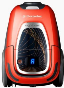
auto (ソーラーオレンジ)